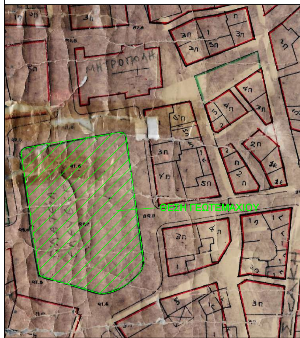
ΑΠΟΣΠΑΣΜΑ ΣΧΕΔΙΟΥ ΠΟΛΕΩΣ - ΚΛΙΜΑΚΑΣ 1:1000